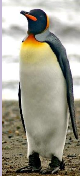
Pingüino de Humbolt